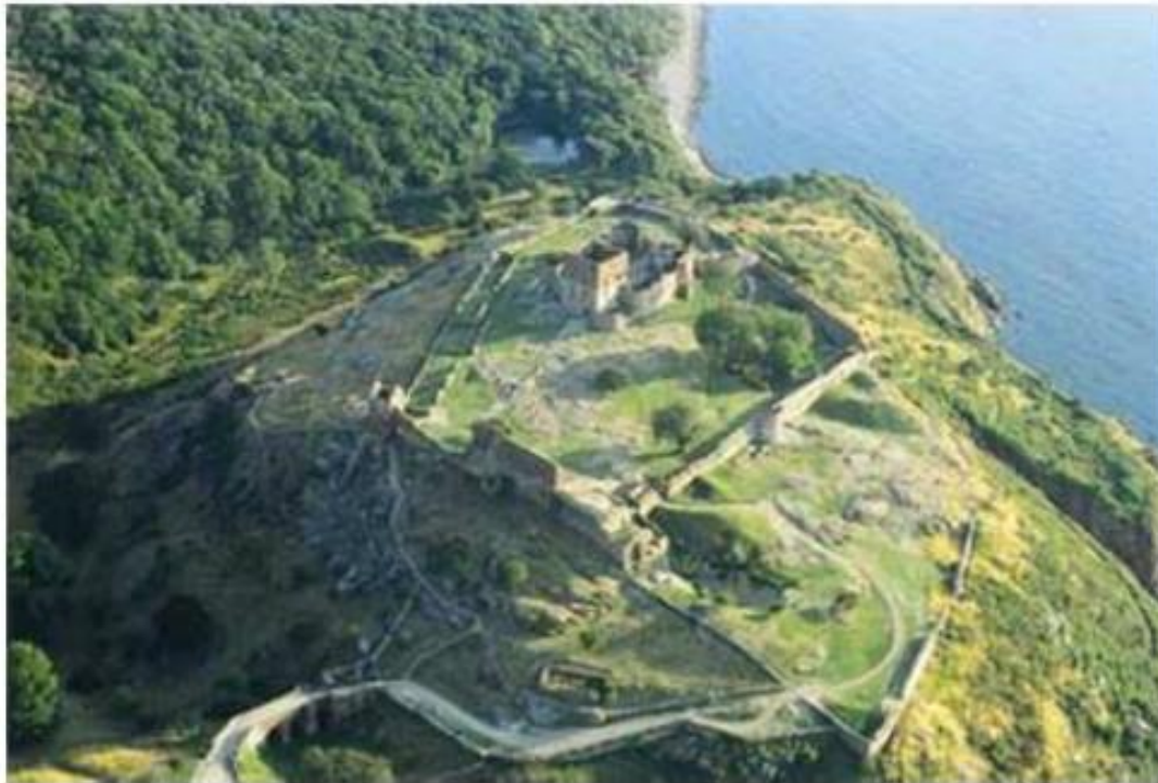
Hammershus – Skov og Naturstyrelsen

http://www.sns.dk/fortidsm/netpub/hammershus/hammershus.htm